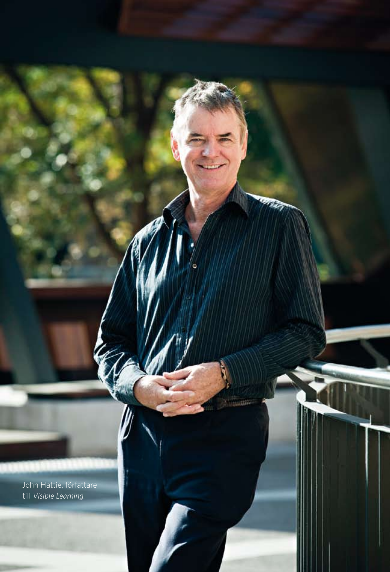
John Hattie, författare till Visible Learning .